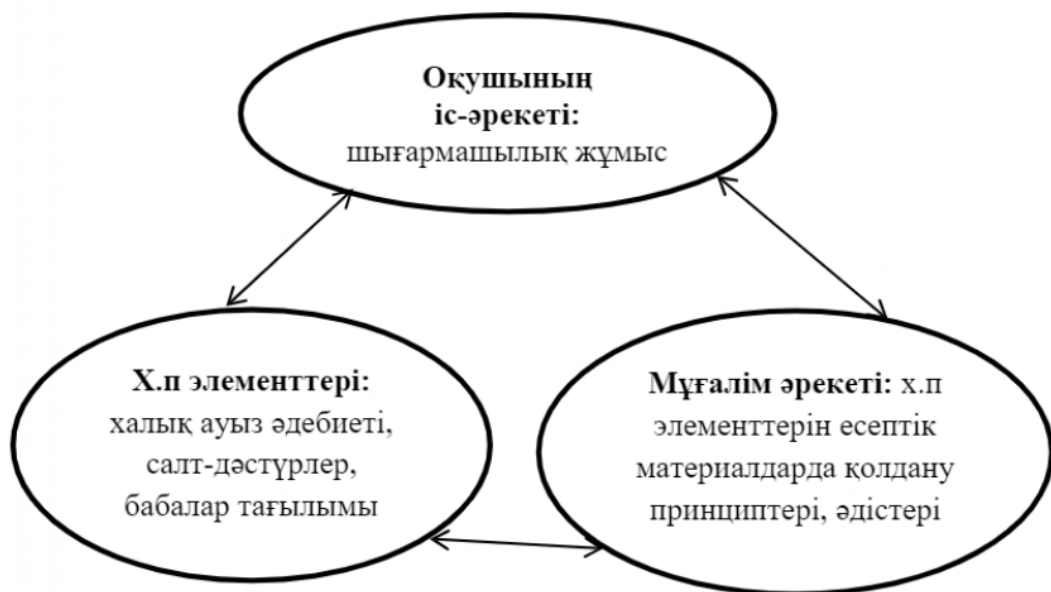
Сурет 1. Халық педагогикасының элементтерін тәрбие жұмысына енгізу

Бала тәрбиелеудегі ежелден қалыптасқан салт-дәстүрлерімізді кешенді түрде жаңғыртып, орта мектепте өтілетін барлық пәндердің мазмұнына енгізудің жолын қарастыру қажеттілігін елдегі ғалым-педагогтар мойындап отыр. Осы тұрғыдан, халық педагогикасы «толқынында» құрастырылған математиканы оқытудың қолданбалық және тәрбиелік бағытын күшейтуді нақты педагогикалық процесте іске асырудың мүмкіншілігі бола алады.