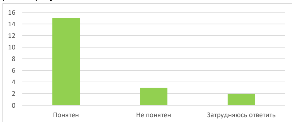
Рисунок 2 – Ответ на вопрос “Понятен ли вам новый материал?”

задать еще один вопрос о том, все ли было понятно на занятии, результаты опроса на рисунке 2.