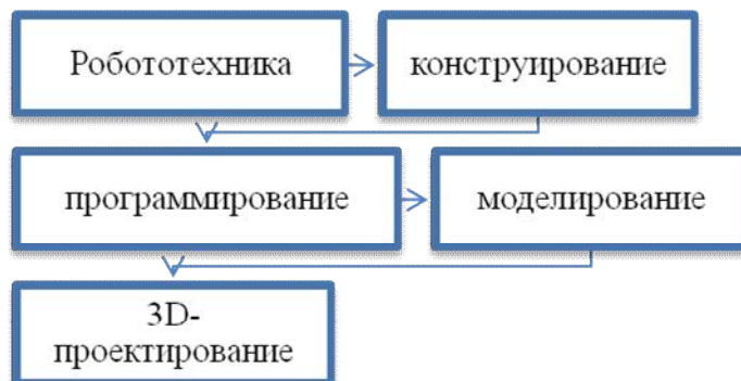
Рис.3. Основные концепции современного преподавания

В настоящее время в мире происходит четвертая технологическая революция: стремительные потоки информации, высокотехнологичные инновации и разработки преобразовывают все сферы нашей жизни. Меняются и запросы общества, интересы личности [2].