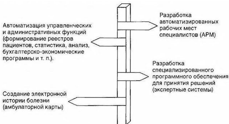
Рис.1. Составляющие компьютерной системы

Административные медицинские системы обеспечивают информационную поддержку функционирования медицинского учреждения, включая автоматизацию административных функций персонала. МИС этого уровня обеспечивают управление больничной, амбулаторно-поликлинической и специализированными службами на административно-территориальном уровне [3].