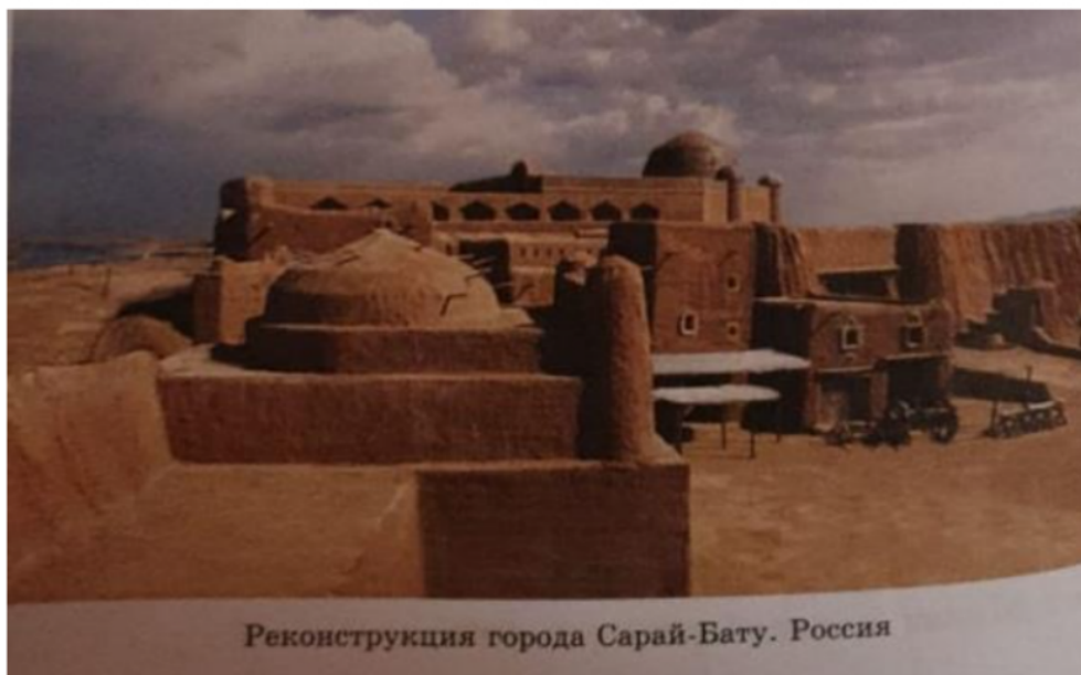
Рисунок 6. Реконструкция города Сарай-Бату.

Примерные вопросы для изучения данного памятника: