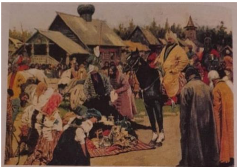
С. В. Иванов. Баскаки (1909)