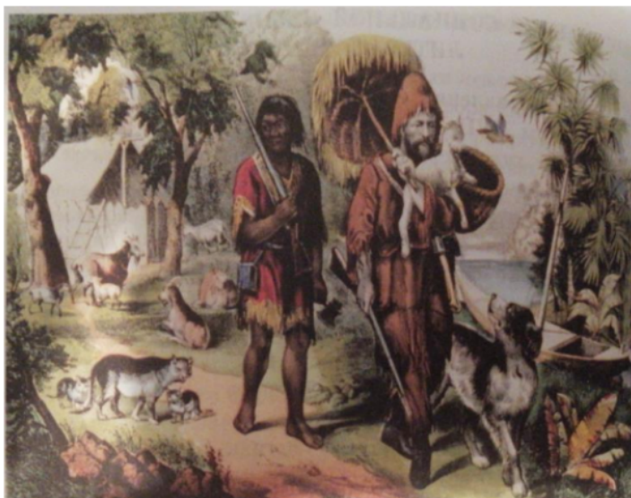
Рисунок 3. Иллюстрация к книге Д. Дефо «Робинзон Крузо»

Рассмотрим междисциплинарную связь истории и литературы на примере мировых литературных произведений.